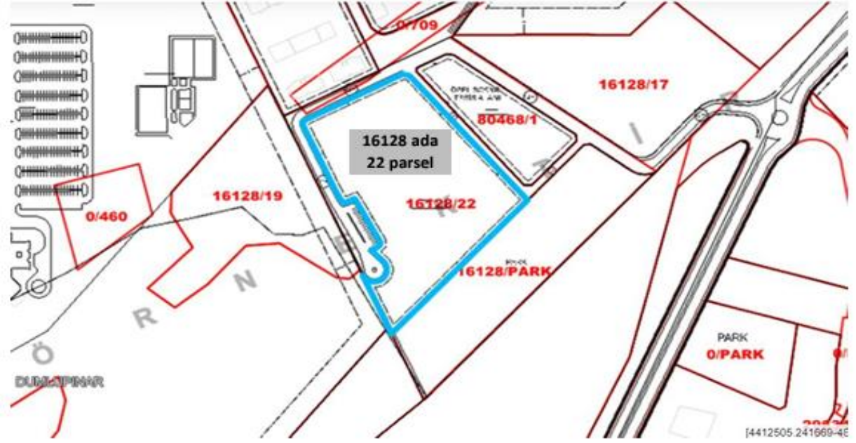
16128 Ada 22 Parsel Dikmen-Çankaya/ANKARA (1)