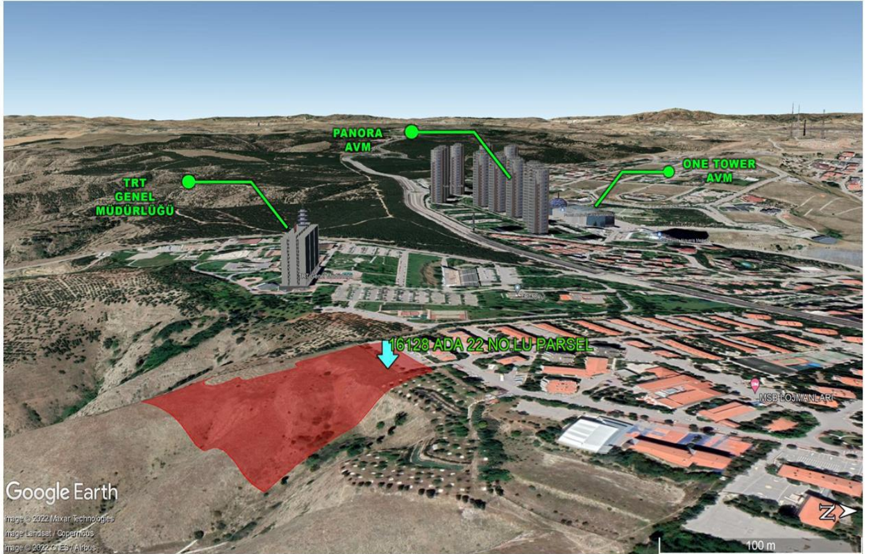
16128 Ada 22 Parsel Dikmen-Çankaya/ANKARA (2)