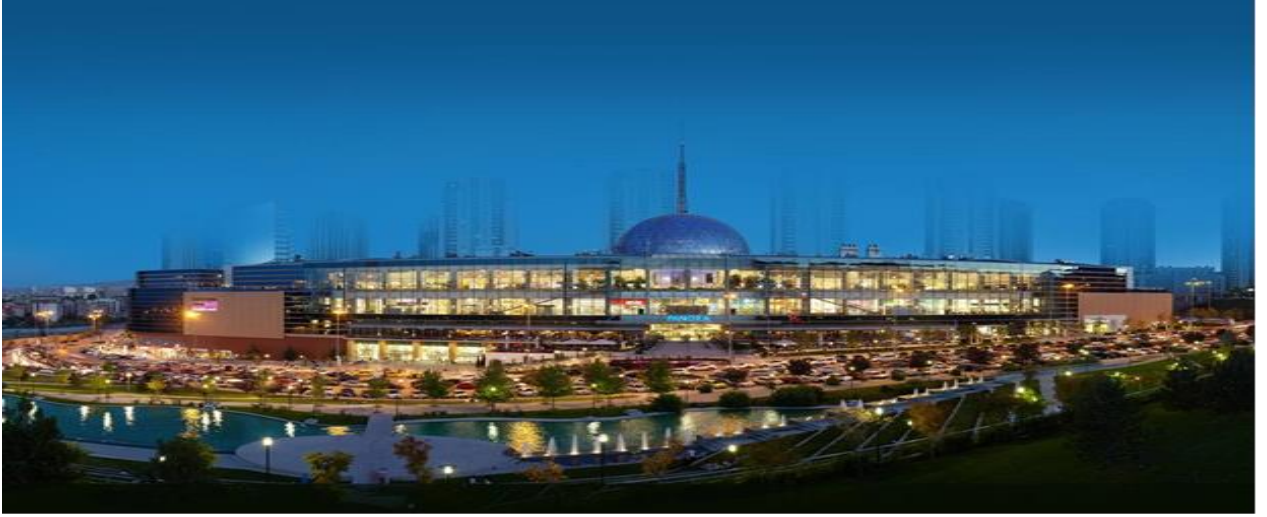
----- PANORA Alışveriş ve Yaşam Merkezi Oran-Çankaya/ANKARA -----

Şirketimiz portföyünde tek gayrimenkul olarak 2007 yılında tamamlanarak faaliyete geçen PANORA Alışveriş ve Yaşam Merkezi bulunmaktadır. Gayrimenkule ilişkin bilgi ve görseller aşağıda sunulmuştur.