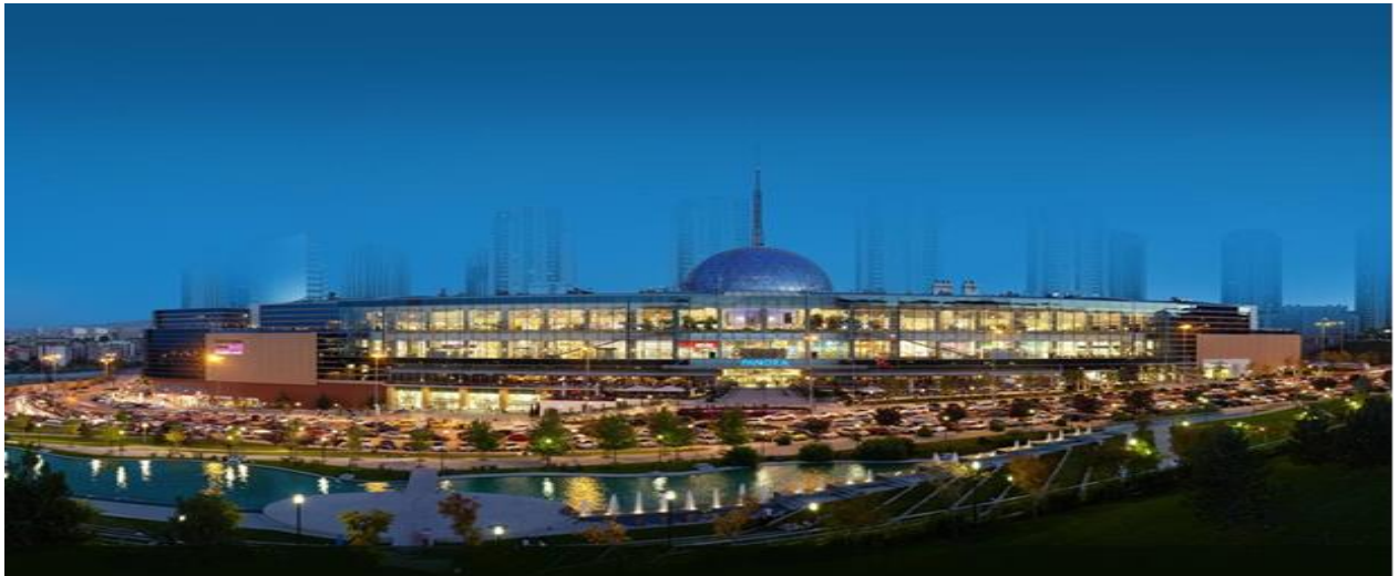
----- PANORA Alışveriş ve Yaşam Merkezi Oran/ANKARA -----

Şirketimiz portföyünde 2007 yılında tamamlanarak faaliyete geçen PANORA Alışveriş ve Yaşam Merkezi bulunmaktadır. Gayrimenkule ilişkin bilgi ve görseller aşağıda sunulmuştur.