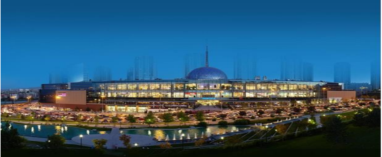
----- PANORA Alışveriş ve Yaşam Merkezi Oran/ANKARA -----

Şirketimiz portföyünde 2007 yılında tamamlanarak faaliyete geçen PANORA Alışveriş ve Yaşam Merkezi bulunmaktadır. Gayrimenkule ilişkin bilgi ve görseller aşağıda sunulmuştur.