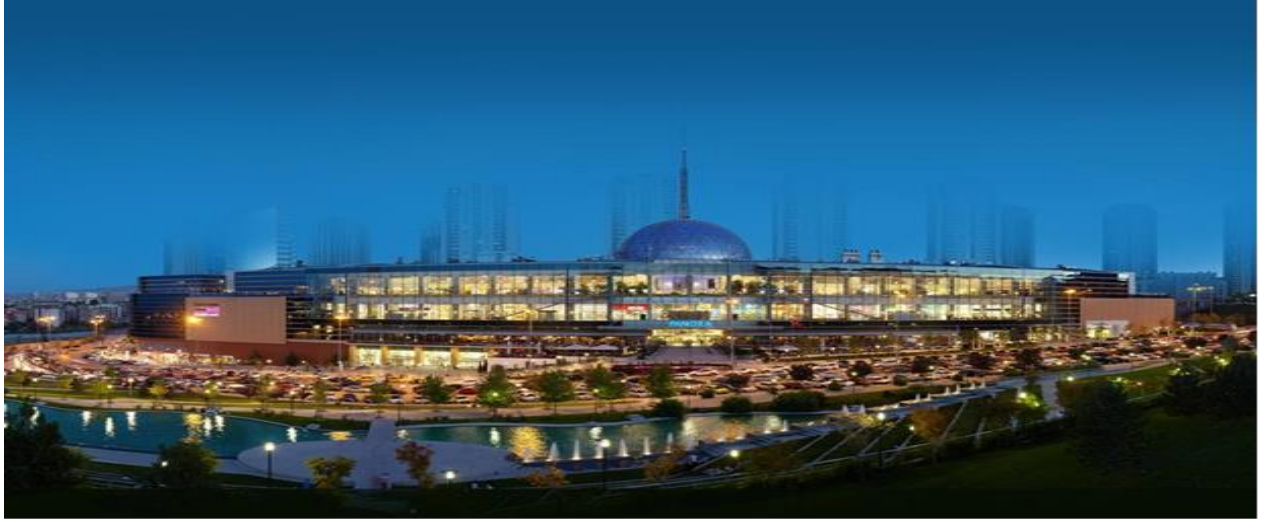
----- PANORA Alışveriş ve Yaşam Merkezi Oran/ANKARA -----

Şirketimiz portföyünde 2007 yılında tamamlanarak faaliyete geçen PANORA Alışveriş ve Yaşam Merkezi bulunmaktadır. Gayrimenkule ilişkin bilgi ve görseller aşağıda sunulmuştur.